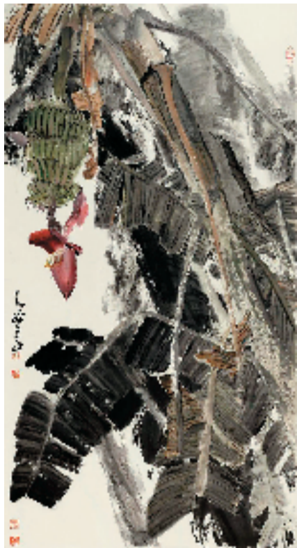
陈鹏 雨后芭蕉 96x180cm 纸本设色 2021年

湖南省文联党组书记、主席夏义生表示,为人民“办好”展览,为人民办“好”展览,是湖南·中国画双年展的宗旨。湖南·中国画双年展重在立足传统、守正创新,以社会主义核心价值观为引领,守护好中国画的文化属性,突出考量当代山水画、