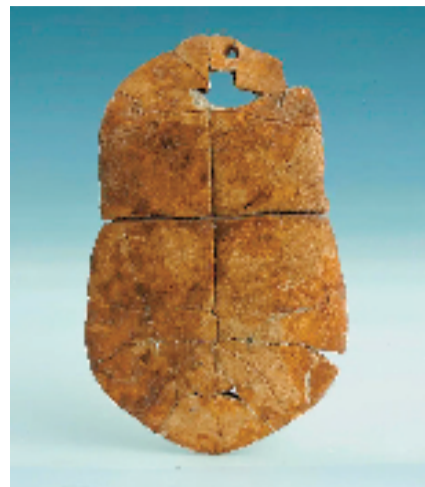
新石器时代 刻符龟甲 河南博物院藏

作为新中国成立后最重要考古发现之一的殷墟甲骨、史墙盘、晋公盘、秦公钟、中山王圆壶、秦始皇二十六年铜诏版