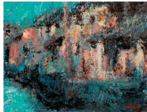
陈逸鸣 水乡即景 28x38cm 油画