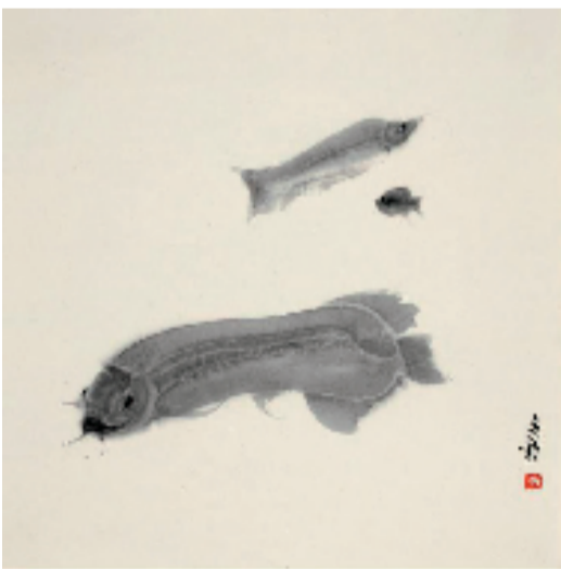
周京新 淡淡的心动 52x52cm 中国画