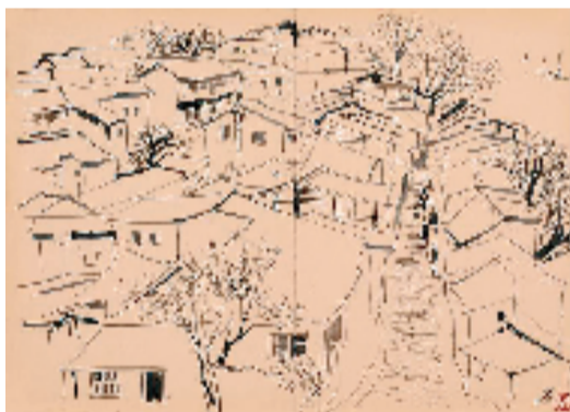
吴 中国画 张大彬 35x50cm