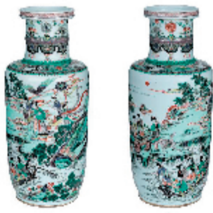
康 瓷器 蔡暄臣 45x20cm

习近平总书记指出,实现“两个一百年”奋斗目标、实现中华民族伟大复兴的中国梦,文艺的作用不可替代,文艺工作者大有可为。总书记的重要讲话为新时代文艺工作指明了前进方向,也是对全体文化艺术工作者的殷切期望。我们期待上海陈琪文化艺术基金会能够发挥自身优势,在弘扬传统文化、提升文化自信、传承海派艺术、培育青年人才、开展沪上艺术家创作交流等方面,奉献更多爱心,作出更大贡献。衷心感谢全国各地广大艺术家对本次活动的支持和关爱,祝愿全国百位名家作品公益捐赠展圆满成功。