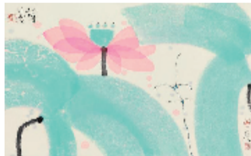
陈家泠 荷美 59x95cm 中国画