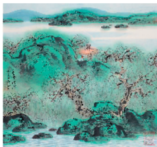
车鹏飞 春亭柳烟 44x48cm 中国画