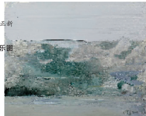
李向阳 非相 40x50cm 油画