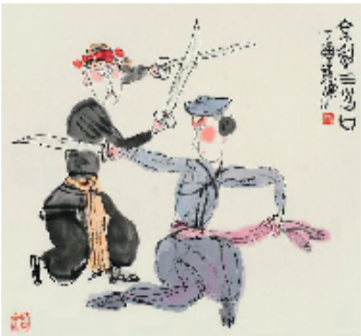
韩 京 48x45cm 中国画