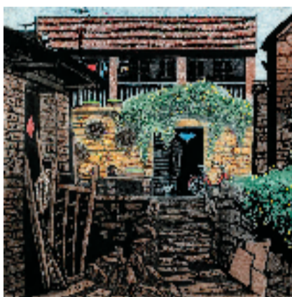
杜荣尧 山寨新居 57x56cm 版画 1992年