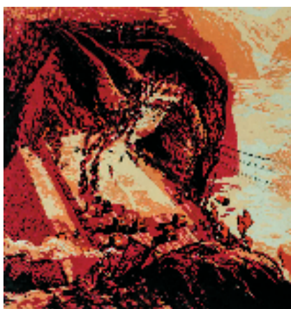
杜荣尧 峡谷的早晨 52x50cm 版画 1971年

主办单位:东阳市文化和广电旅游体育局 承办单位:卢甫圣美术馆(东阳市美术馆) 展览时间:2023年6月30日——7月29日 展览地点:东阳市卢宅木雕巷8号