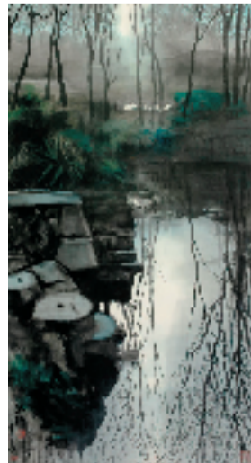
杜荣尧 池影 95x178cm 中国画 2001年