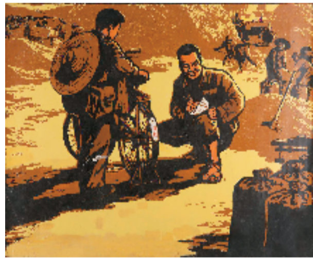
杜荣尧 蹲点 59.5x49.5cm 版画 1972年