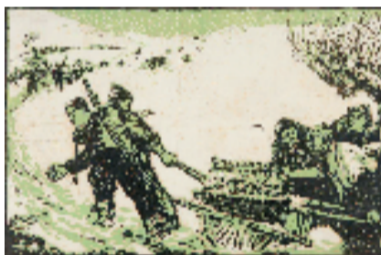
杜荣尧 相帮 40x30cm 版画 1959年

杜荣尧(1927-2004),别名平沙,浙江东阳人。中国美术家协会、中国版画家协会会员,浙江省版画家协会会员、曾任金华市美术家协会顾问,东阳市美术家协会主席、顾问。东阳中学高中毕业后加入中国共产党,并参加东磐游击队。1949年入伍,曾任部队政治部、文化部美术创作员,海军青岛基地美术组组长、海军政治部《人民海军报》美术编辑,1958年转业回东阳。版画作品多次参加全国美展、全军美展,多次在国内外展出。1992年获浙江省版画创作突出贡献奖,1996年获全国鲁迅版画奖。作品被中国美术馆、大英博物馆等机构收藏。周恩来总理曾将其版画《海上风景》作为国礼送给印尼总统。兼作中国画创作,以造詣精湛的版画为基础,同时借鉴西洋画、水彩、油画,兼容并蓄,大胆挥毫,自成一格。1995年在北京中国美术馆举办个人版画展,1998年在日本东京举办个人版画展,2002年在北京中国画研究院展览馆举办个人中国画展。出版有《杜荣尧画集》、《中国书画名家名作方阵·杜荣尧》等。