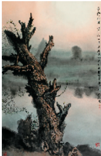
杜荣尧 原野初醒 120x190cm 中国画 2002年