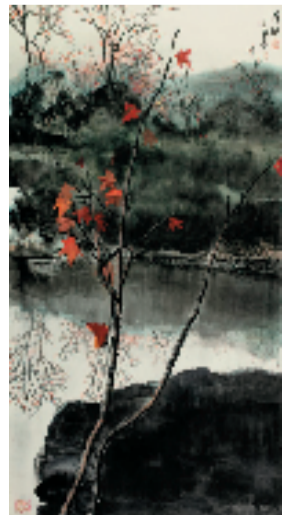
杜荣尧 深秋 94x180cm 中国画 2001年