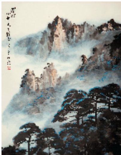
杜荣尧 朝晖 80.5x64cm 中国画 1992年