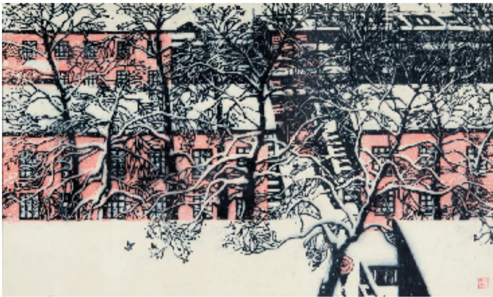
杜荣尧 雪 64x38cm 版画 1988年

主办单位:东阳市文化和广电旅游体育局 承办单位:卢甫圣美术馆(东阳市美术馆) 展览时间:2023年6月30日——7月29日 展览地点:东阳市卢宅木雕巷8号