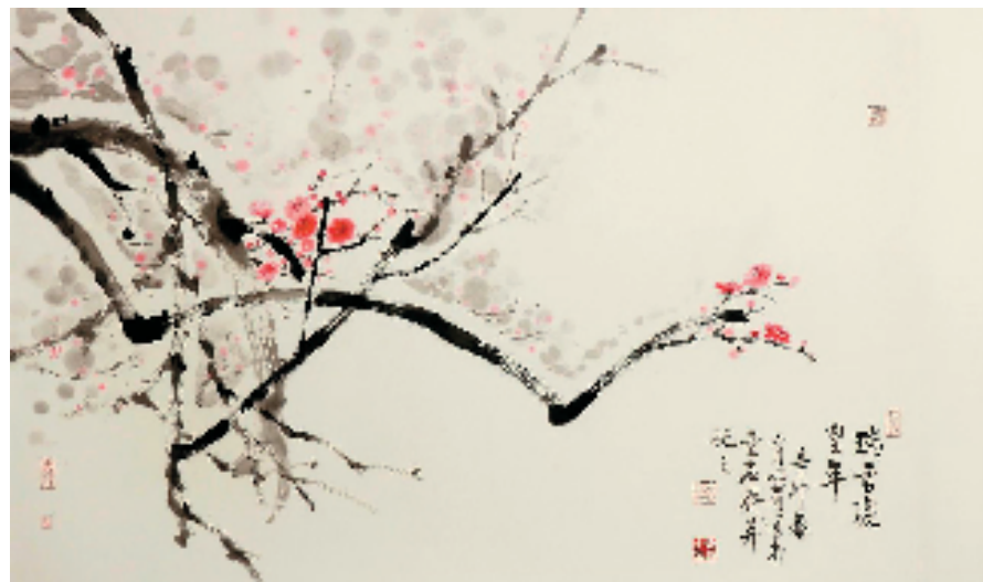
龚心甫 瑞雪庆丰年 62x95cm