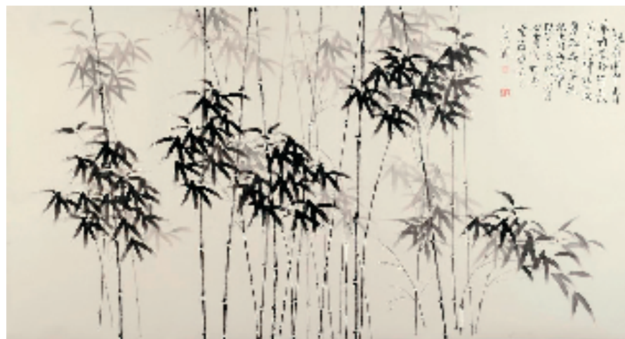
龚心甫 清气润人间 98x180cm