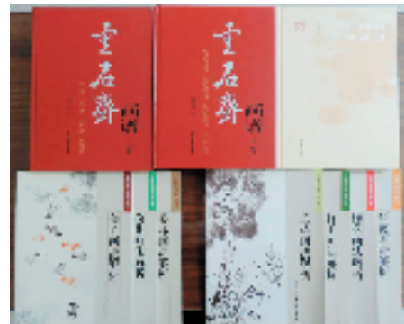
龚心甫撰著的部分书籍