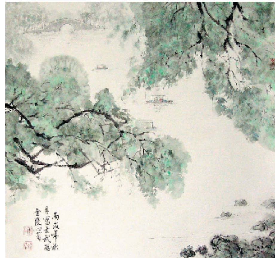
龚心甫 玄武湖 70x73cm

此图的树干、树枝用书法“屋漏痕”笔法写之;树叶用水迹染法渲染数次,然后用淡绿色渲染,达到水迹、墨迹、色迹混合的肌理效果,表现树木茂盛、清朗之意态。右下侧坡石采用传统画石的皴法,水纹亦用传统笔法绘写。