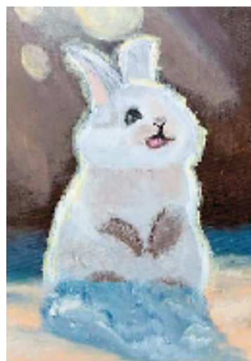
◀奇奇(温州市百里路小学)可爱的兔子

颜色丰富,用色大胆鲜艳,构图饱满大气,让整个画面的视觉中心非常的强。画面也有自己的特点,不接受约束,画面妙趣横生,体现出童真稚趣,让人置身于光怪陆离的世界。