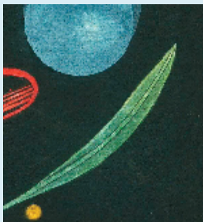
有魔法的符号·“植物”