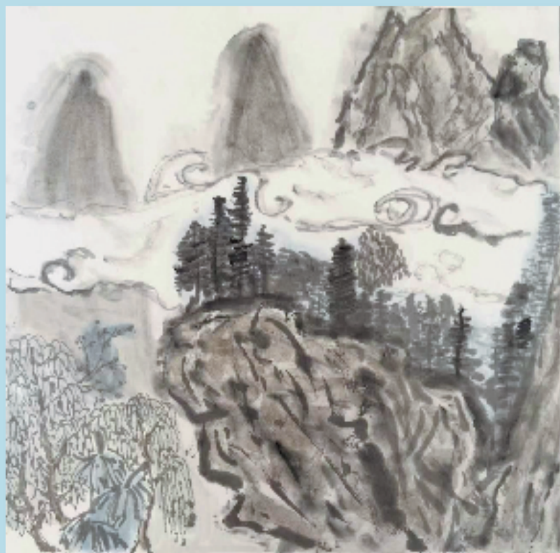
黄炫华(11岁 中山市东区香山小学) 云雾缭绕