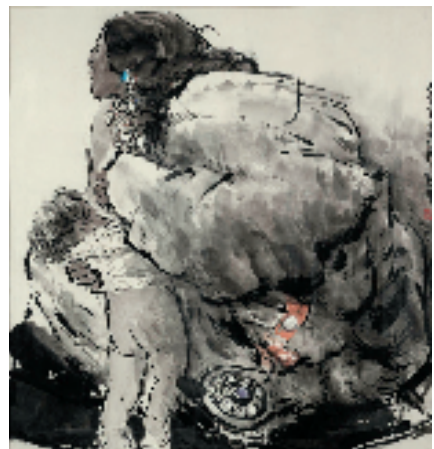
方增先 母亲 101.5x95.5cm 中国画 1988年 民间艺术的表现形式和内容。 这些“活水”取之不尽，用之不竭。

民间艺术(包括少数民族艺术)体现了广大百姓最为朴素的精神诉求与审美表达，他们在与自然长期打交道的过程中，凭借勤劳和智慧，就地取材，因势利导，在生活中创造出了精彩纷呈多种多样的