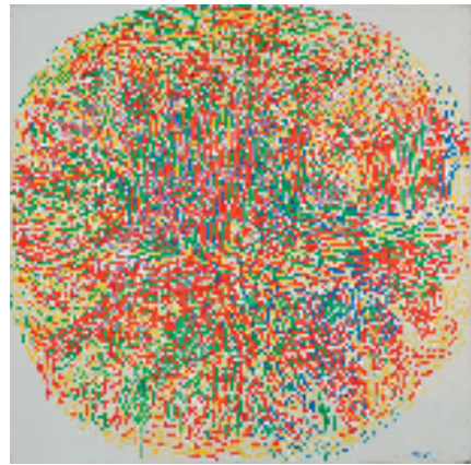
余友涵 圆系列91-5 200x198cm 油画 1991年

从这十一件作品的解读中，你也许能够听到：一个当初喜欢糖纸、一个勇敢地曾经想要用双手去接住快要掉下来的钢板和股市中飞刀、一个喜欢追剧看片3分钟就能知道此剧是否会热播、一个最大的理想就是开家馄饨店、一个忙到从未有过更年期的、一个一直有颗少女心的一直喜欢偷着乐的一直唱歌跑调的一直不会倒车停车的一直煮鸡蛋忘关火烧焦锅的一直注重第一眼的一直被偶然的幸运推着走的有一点完美情结的有一点点小执着的有一点点小笨的有一点点小自卑的又有一点点特别小自信的简简单单的大妈，因为这个素人展停下来安静地回忆和思考着人生的一段又一段的画外音和心里话。