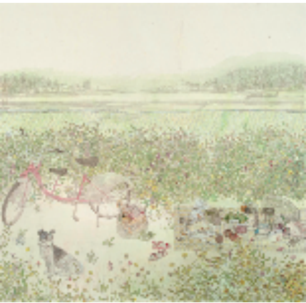
鲍莺 不一般的城市公园 227x221cm 中国画 2021年

当然我还是更喜欢紧张过后的平静和安稳，所以在策划中怀想我的工作，念及与孩子家庭的亲情时光，以及在忙碌工作之外我最爱的旅游，去看到周边和世界各地的风景风情，策划的结构和作品的选择就从这里入手了。你可以想到我的工作有多紧张忙碌，而在我选择的画作中就有多阳光温馨平和，也许这也是种艺术的反差美吧。