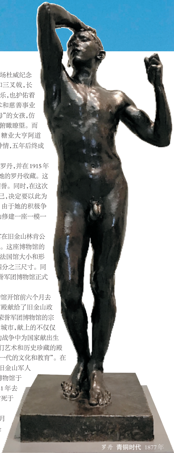
罗丹 青铜时代 1877年

其实,所有的激情和荣誉,岁月都会真诚地保存。因为,岁月,就是历经沧海桑田而依然清明的眼睛。