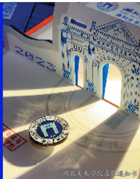
湖北美术学院录取通知书

录取通知书是高校给大一新生的“见面礼”，也是高校给新生们写下的第一封“书信”。近期，在社交媒体上，不少新生“晒”出通知书，对即将展开的人生新旅程充满憧憬。这也正是高校用心设计录取通知书的初心所在。这些通知书不仅颜值在线，还蕴藏巧思，于方寸之间展现各大学的特色与理念，同时也给予新生一份仪式感。这些年来，录取通知书的意义，早已超越了“通知”功能，成为一种精神的传承。在收到录取通知书的那一刻，新生与高校的情感连接便就此展开。在满满创意与深深寓意里，一封封录取通知书饱含学校对学子们的深深期许。本期让我们看看各艺术院校“上新”的录取通知书。