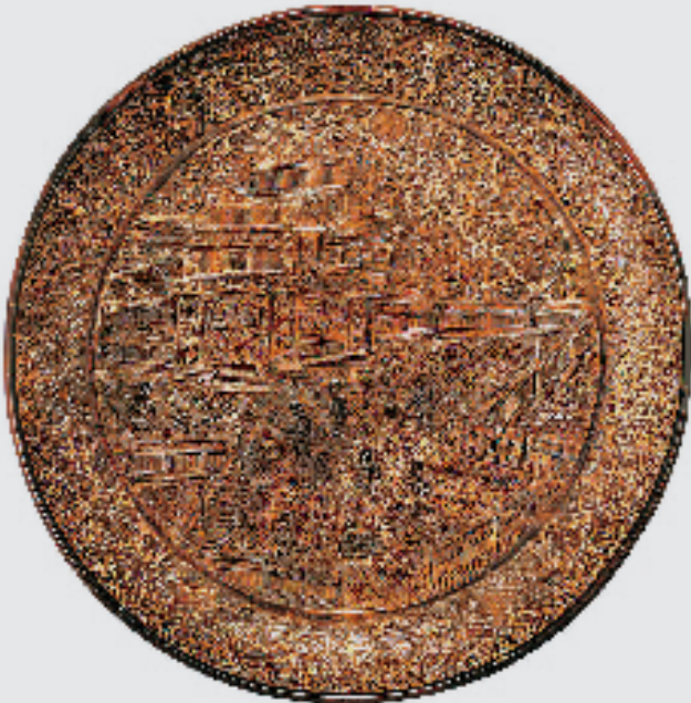
南宋 楼阁人物剔黑盘 高4.5cm、口径31.2cm 日本东京国立博物馆藏