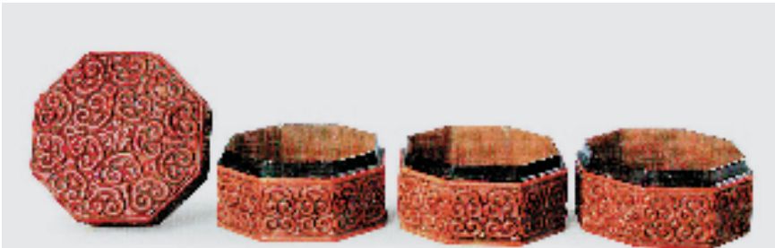
南宋(端平二年[1235]) 剔犀如意云纹八角奩(组合)

到了宋代,迎来了中国漆器艺术风格和审美趣味转向优雅极致特色的重要阶段,并且为雕漆艺术成为中国漆器艺术代表奠定了坚实的基础。雕漆艺术自唐代开始便融合雕刻与漆工艺的发展,逐渐形成了相对独立的漆艺类型。生活在杭州的明代人高濂便在其鉴赏名著《遵生八笺·燕闲清赏笺》中谈到“宋人雕红漆器”时称:“如官中用盒,多以金银为胎,以朱漆厚堆至数十层,始刻人物、楼台、花草等像,刀法之工,雕镂之巧,俨若画图。有锡胎者,有蜡地者,红花黄地,二色炫观。有用五色漆胎刻法,深浅随妆露色,如红花绿叶,黄心黑石之类,夺目可观,传世甚少。”这里,高濂描述到了宋代雕漆的精妙极致,刻画“人