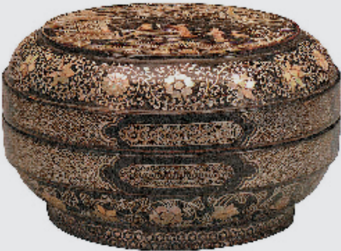
南宋一元 黑漆嵌螺钿人物图盒 直径25.5cm、高14.4cm 浙江省博物馆藏