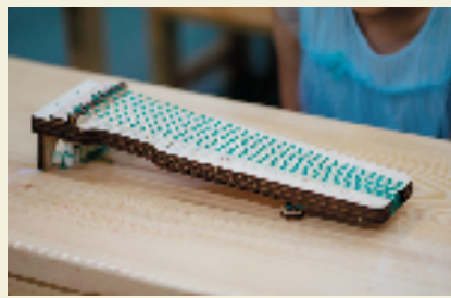
小朋友自己动手制作的古琴模型