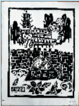
陈恩婷 迎亚运 版画