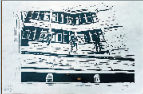
慎铨熠 博学楼 版画