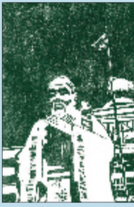
姜宇启 孔子像 版画