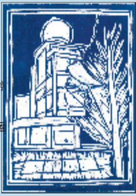
桧 松 版