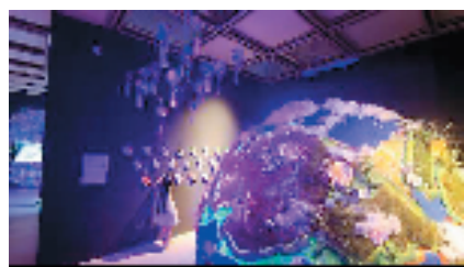
“大地拾遗”首届青少年社会美育艺术装置展宁波巡展

该展览以“大地”为主线,通过多样化的地理人文视角,描绘出了中国丰富多彩的本土文化,同时在宁波巡展中,更是在新的作品中融入了宁波本土的文化元素,让观众体会脚下甬城土地千年来所凝聚的文化魅力。通过不受拘束、天马行空的想象与实践,展现出了艺术在孩子手中的无限可能,除了装置作品本身带有的互动性给展览增添的独一无二的参与感,还可以通过现场设置的打卡点进行打卡,以“探索互动”的方式来加深对于