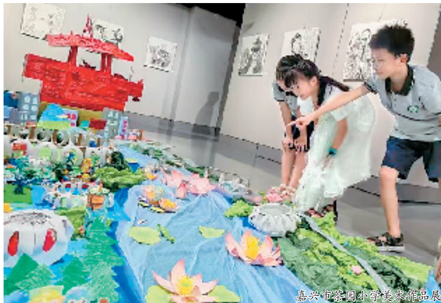
嘉兴市茶园小学美术作品展

通讯员 张诗瑶 浙江嘉兴作为革命红船的启航地,正在演绎精彩“新传奇”。8月20日,在大美南湖红船畔,嘉兴市茶园小学以“丹青赓血脉 彩绘襄亚运”为主题的美术画展在嘉兴市图书馆与大家见面。