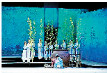
乡村儿童艺术嘉年华

育是推进教育均衡的重要抓手,也是实现乡村乡村振兴的重要手段。所以,戏剧带给孩子、带给光山的已经远远超过了戏剧本身,这是乡村儿童艺术嘉年华的真正意义。”中国儿艺党委副书记、纪委书记王晓松如是说。