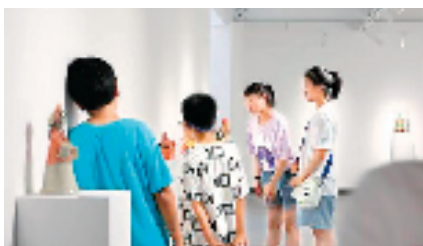
“陶溪川杯”儿童青少年陶瓷作品展

此次展览来自全国各地的参与作品总数超过10000件/组,在经过20位评委的认真遴选和综合考量,在中央美术学院陶溪川美术馆和景德镇陶瓷大学美术馆两个美术馆展厅,共展出了561位参展作者的602件/组作品。众多生动有趣的作品展现了孩子们朴拙天真,体现孩子们朴素的审美情趣和对美好的向往。