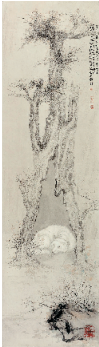
刘万鸣 意笔精微 123.5x35cm 纸 2023年

2012年获中国青年艺术家提名奖,2014年入选国家百千万人才工程授予“有突出贡献中青年专家”称号,享受国务院政府特殊津贴专家,中宣部2017年文化名家暨“四个一批”人才、中组部国家高层次人才特殊支持计划领军人才“万人计划”。