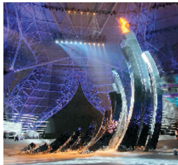
主火炬“钱江潮涌”现场图

设计之初,导演组没有给出任何框架,让我们自由发挥,所以一开始我们很发愁,不知道怎样找到合适的方向。我看了很多往届奥运会、亚运会等大型赛事的主火炬和点火仪式,也研究了本届亚运会的“薪火”火炬等设计。有时候,我会一个人跑到“大莲花”体育馆,坐在