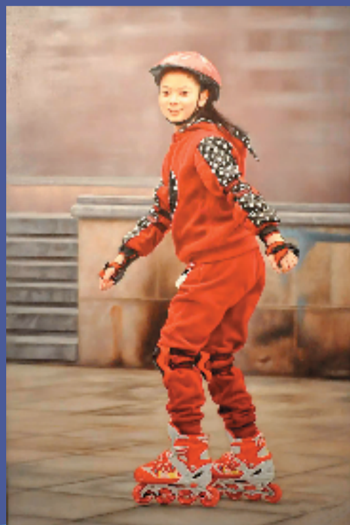
褚建禹(天津) 梦飞扬 182×120cm 油画