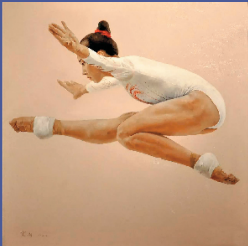
窦剑(北京) 起舞 120×120cm 油画