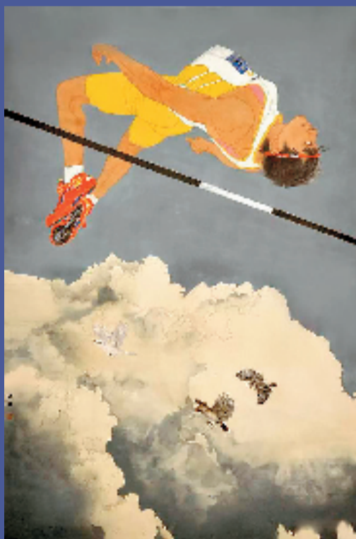
洪日(安徽) 跃过云端伴鸟飞 227×150cm 中国画