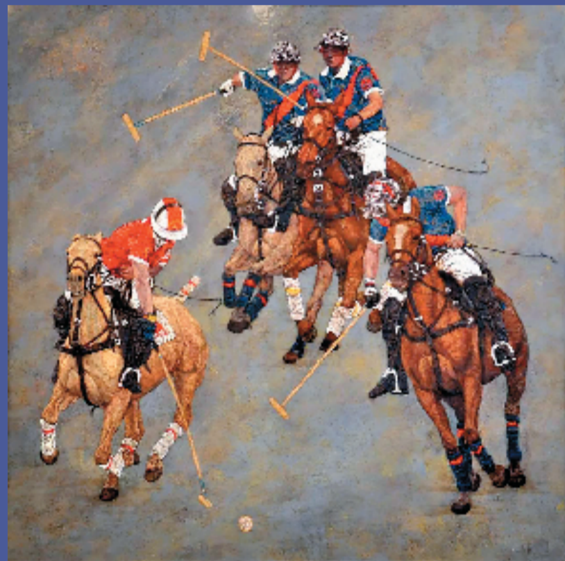
左庆一(福建) 一马当先 120×120cm 漆画