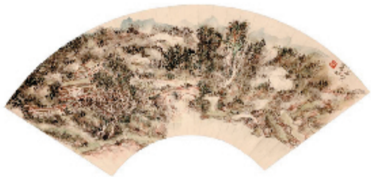
黄宾虹 春山话旧 18×50cm

本报讯 报艺 为庆祝杭州第19届亚运会召开,向世界介绍中国艺术,彰显民族文化自信,中国美术学院国家艺术基金传播交流推广资助项目“不朽的遗产——黄宾虹与二十世纪中国美术”特展于9月26日在杭州市吴山明美术馆开展。