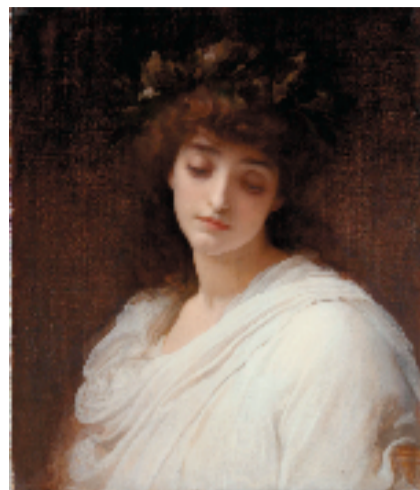
弗雷德里克·莱顿(1830—1896) 挽歌 油画 1888年 英国利物浦国家博物馆-沃克美术馆藏

纳到莱顿,展现英国绘画的黄金时代。作品主题丰富,勾勒维多利亚时代风光与世情。从自然风光、乡村、城市街道到家庭、人物、生活,从中世纪的幻想到古罗马、古希腊艺术的再现,让我们惊叹于大自然的波澜壮阔,沉溺于英伦乡村的恬淡宁静,感慨于拉斐尔前派的超越时代。