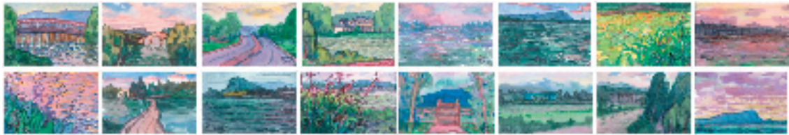
骆献跃 湘湖 12.5x18cmx16 布面油画 2023年