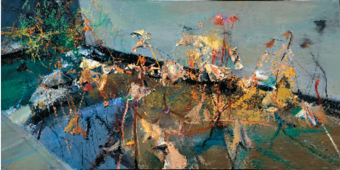
杨参军 荷塘之一 100x200cm 布面油画 2023年