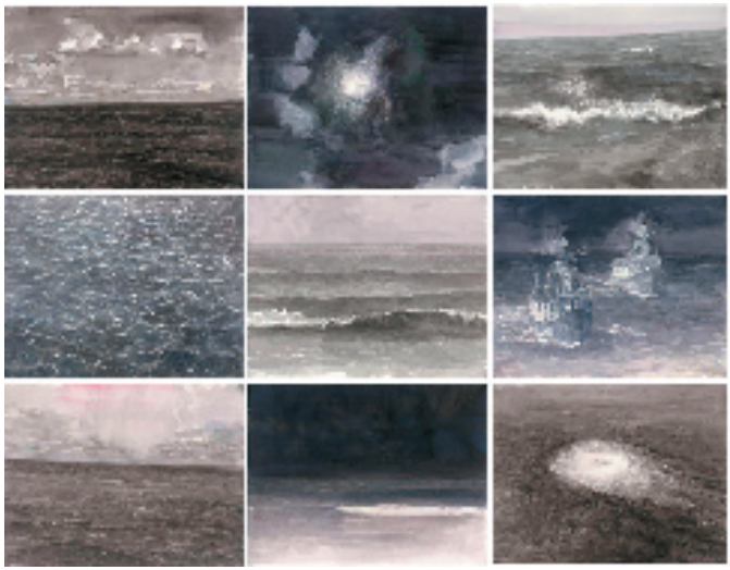
王敏杰 在海上 31x43cmx9 纸本水彩 2023年