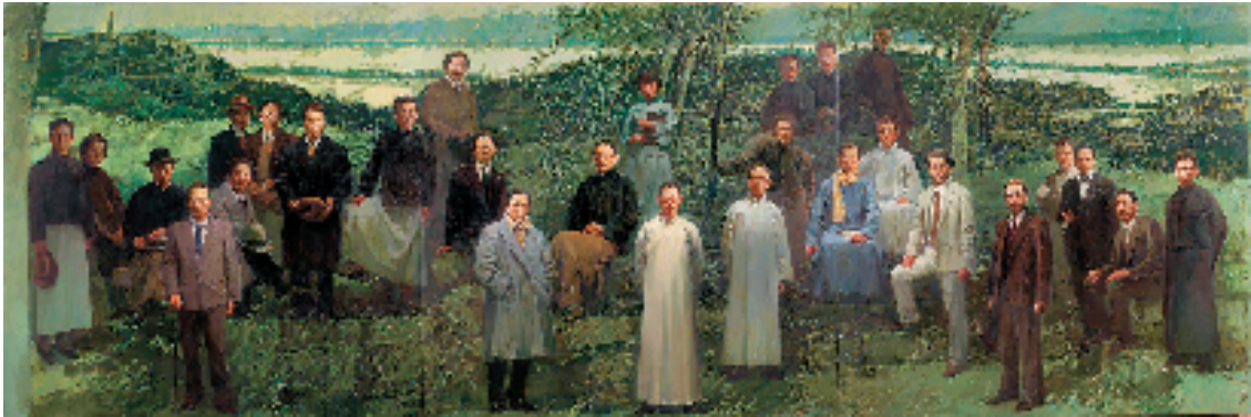
许江、孙景刚、郭大勇 国美春秋——清明 300x900cm 布面油画 2018年