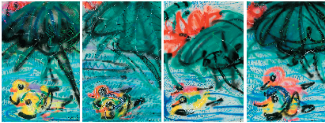
常青 十里湘湖不羡仙 74x47.5cmx4 综合材料 2023年