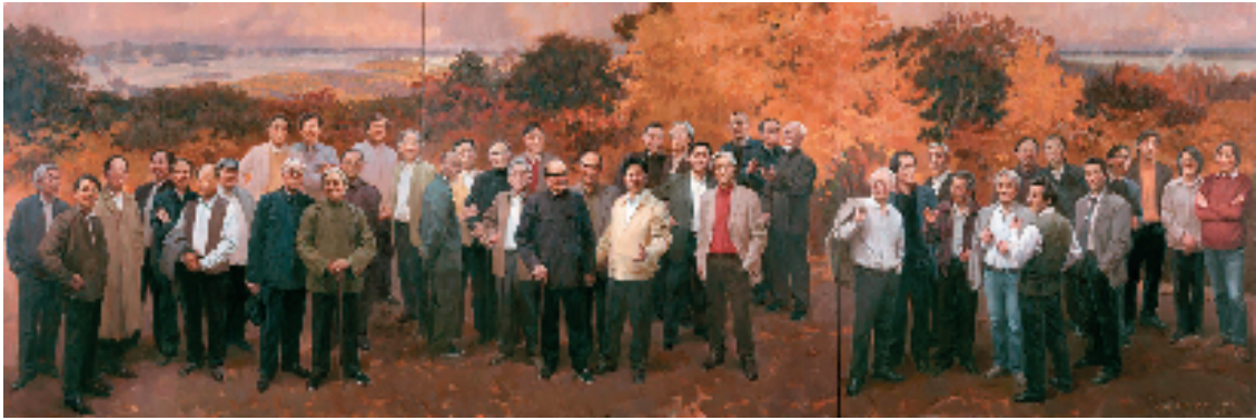
何红舟、任治忠、尹骅 国美春秋——中秋 300x900cm 布面油画 2018年