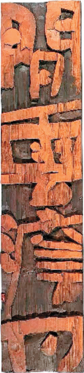
杨金凯 闲云淡月 刻字