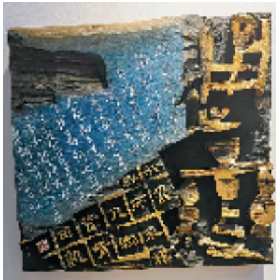
冷彦静 通变 刻字