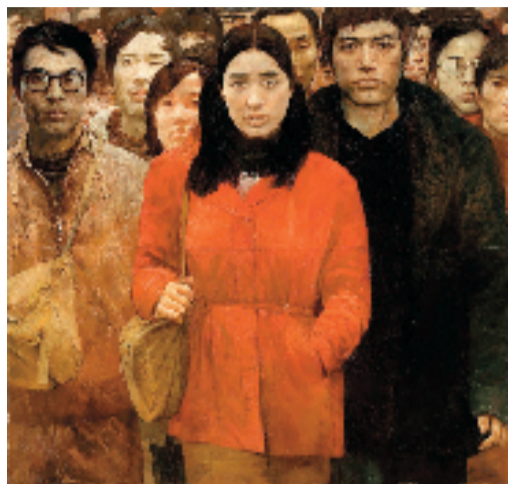
何多苓、艾轩 第三代人 油画