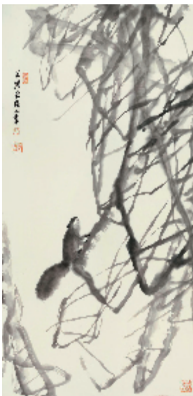
朱颖人 69x138cm 2022年