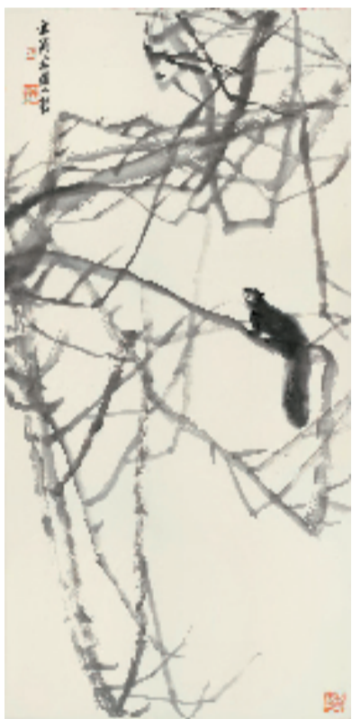
朱颖人 69x138cm 2022年