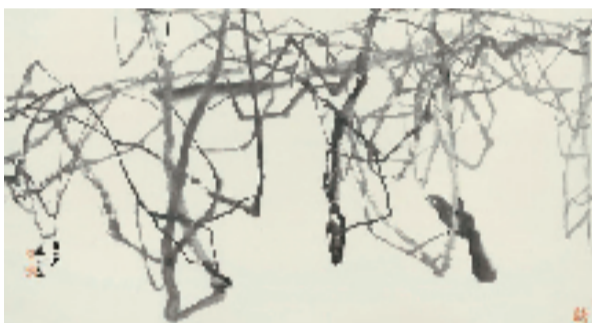
朱颖人 181x97cm 2022年