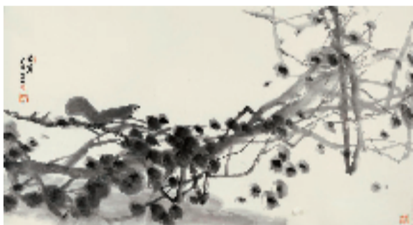
朱颖人 181x97cm 2022年