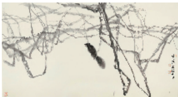
朱颖人 181x97cm 2022年