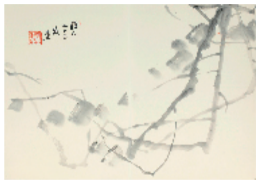
朱颖人 68.5x47.5cm 2022年