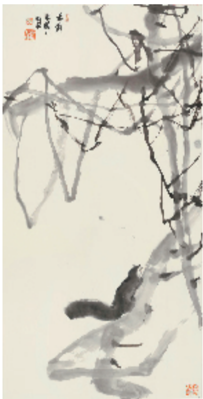
朱颖人 69x138cm 2022年