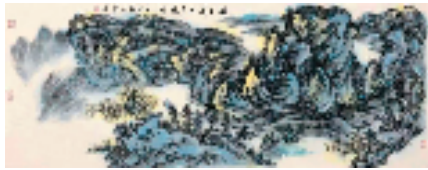
刘荣 满目青山夕照明 70x180cm

刘荣是中央美术学院教授、博士生导师,其创作的山水画是学院派中国画。大自然之千岩万壑、草木峥嵘,无一不在他的笔下得到充分的表现。品读他的画作,我们可以体会到他对自然山川