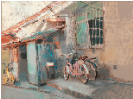
周建捷 巷之六 39.5x54.5cm 2022年

“本次我的参展作品偏向静物和人物,我曾在设计院做过很长时间的设计师,在创作时会有想突破传统静物绘画模式的一种尝试,展出的作品代表了我过去