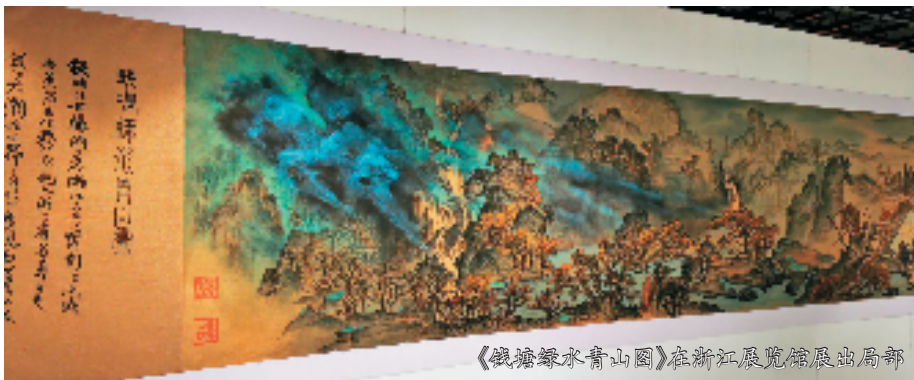
《钱塘绿水青山图》在浙江展览馆展出局部