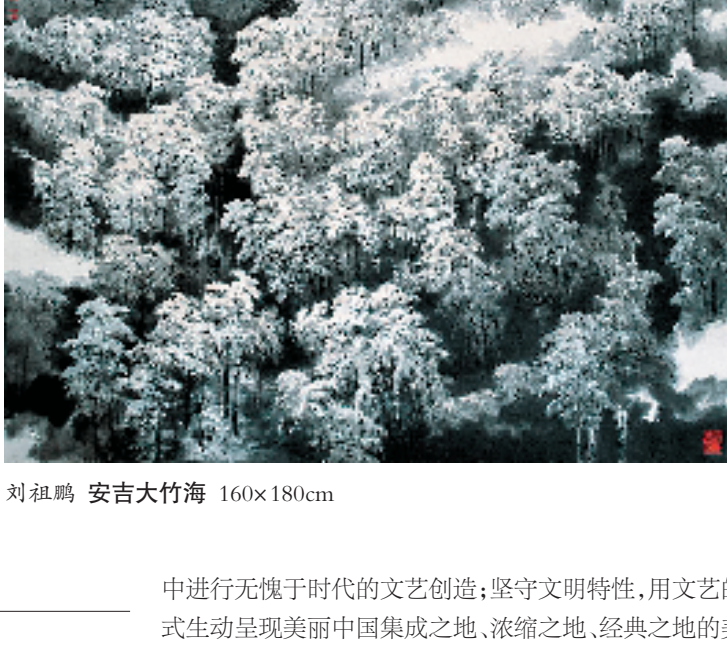
刘祖鹏 安吉大竹海 160x180cm

国家级美术师 中国美术家协会会员 中国画学会创会理事 湖州市美术家协会第一、二、三届主席 湖州书画院第二任院长 2012年入载刘曦林著《二十世纪中国画史》