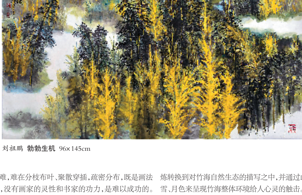
刘祖鹏 勃勃生机 96x145cm