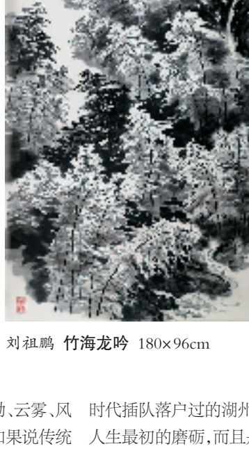
刘祖鹏 竹海龙吟 180x96cm