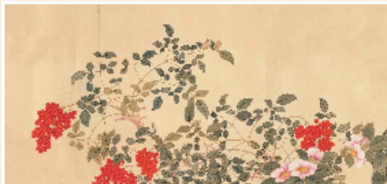
清 钱维城 淑景迎韶图(局部图中的天竹) 台北故宫博物院藏

天竹终年常绿,秋季结果实,遇到霜降,果实变成红色,朱红色的浆果像一颗颗的珊瑚珠子。天竹虽不能食用,但属于古人冬季喜爱的观赏果。它与其他冬季开放的花卉一起,既装扮了古人的生活,也被赋予了吉祥如意。天竹与山茶,还常常出现在古人“岁朝清供”的植物名单中。在萧瑟的正月里,为古人送去鲜艳的色彩,也送去春天的讯息。