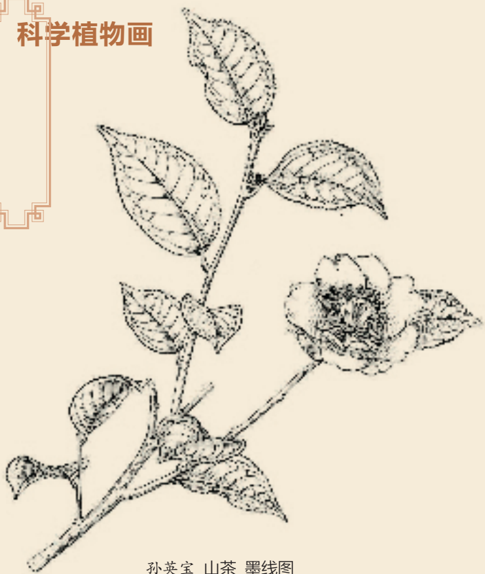
孙英宝 山茶 墨线图

要解密这幅“文人画”风格的作品,关键是要理解“文人画”里的画家题字。这幅画面中的题字并不多,但内涵却很丰富。通过扇面上短短的14个字和两枚印章,我们能认识四位清代的文人,这很神奇吧!