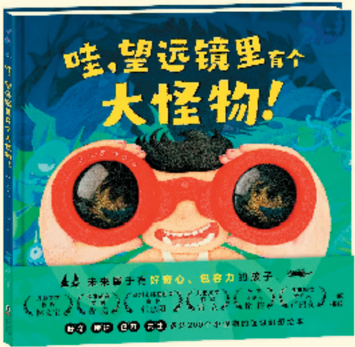
《哇，望远镜里有个大怪物》封面 孙昱/文 曾静/图