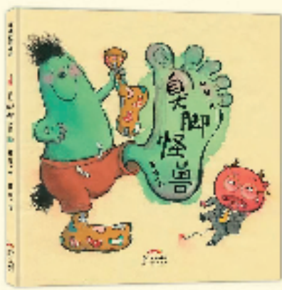
《臭脚怪兽》封面 孙昱/文 钟彧/图