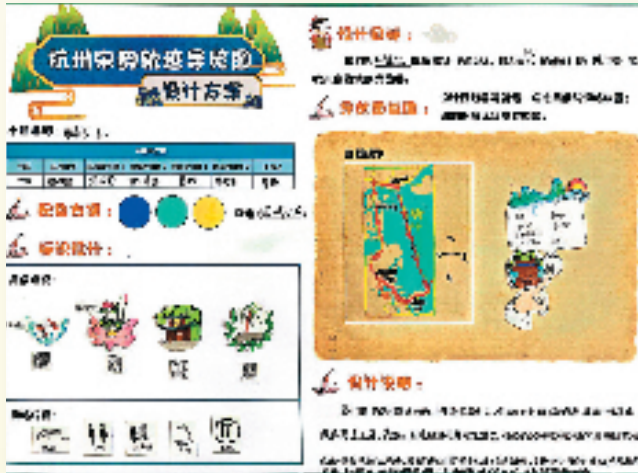
学生设计绘制草图方案