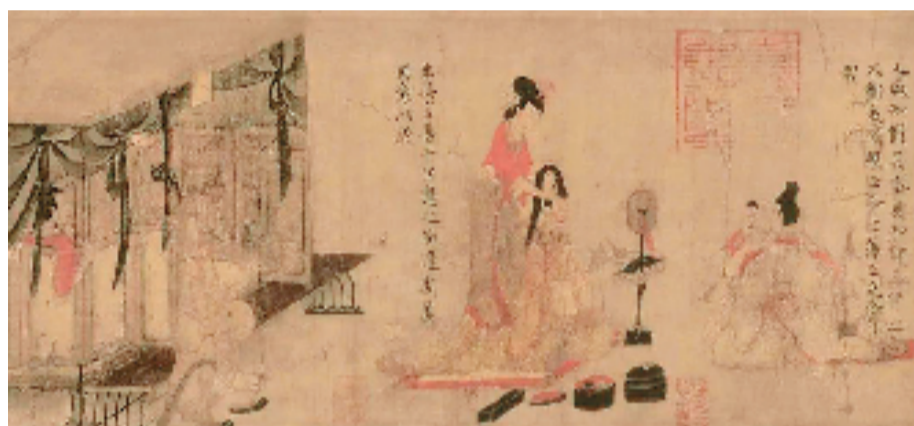
东晋(传)顾恺之《女史箴图》(局部) 现藏于大英博物馆(原项元汴旧藏)