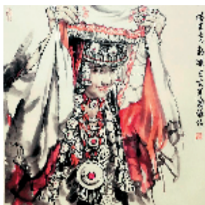
姬国强 塔吉克新娘 国画

姬国强,1956年生,西安美术学院教授,硕士研究生导师。早年师从刘文西、陈忠志、湛北新等一批艺术大师,其艺术生涯见证了中华艺术的繁盛。在泼墨丹青间,不仅仅绘画,更是在历史长河中穿