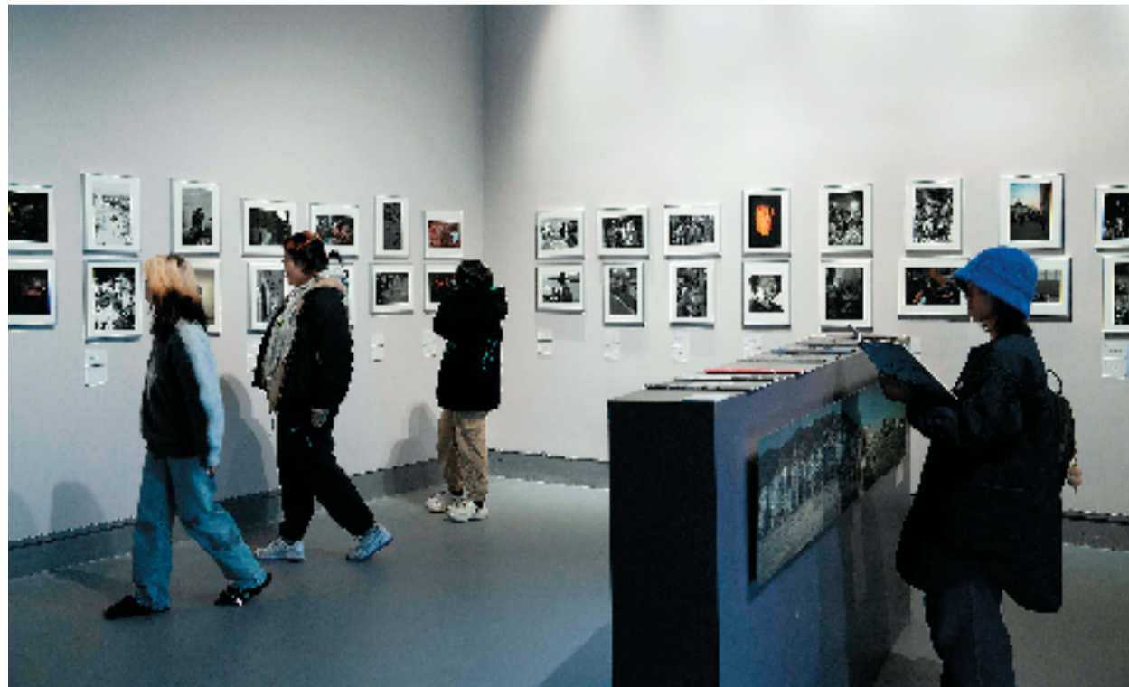
展览现场

(本文为“列岛·影像志”前言,标题另拟,作者系中国美术学院跨媒体艺术学院媒介展演系主任、教授)