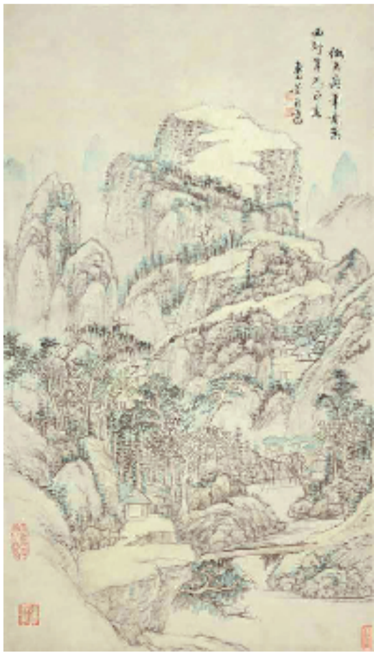
清董邦述山水 (77.5x44.5cm) 纸本设色