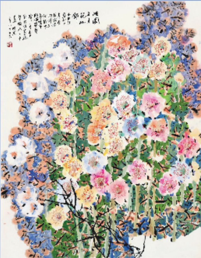
郭怡琮 怡园五月花似锦 116x96cm 纸本设色 2019年

通过本次双展及系列活动,艺术家与学者们齐聚一堂,分享花鸟画艺术的教学创作方法与理念,为艺术家的创作实践与艺术理念,以及高校间的学科建设与教育改革,花鸟画艺术的发展带来新的契机。(王金阳)