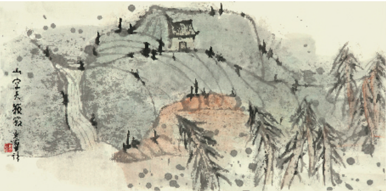
罗步臻 山空天籁寂