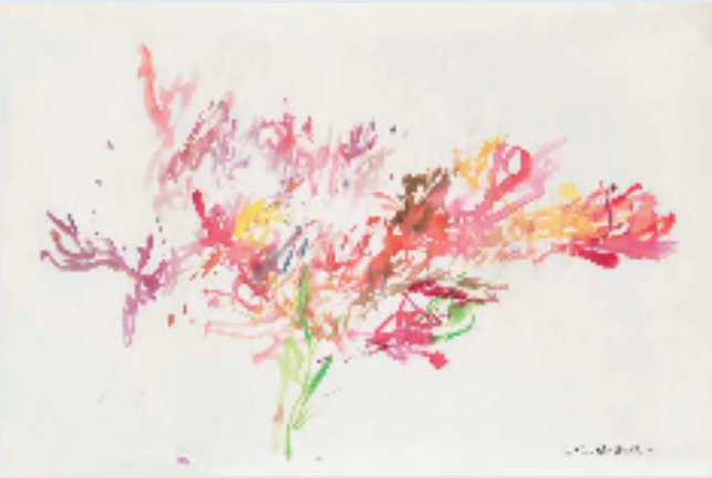
赵无极 无题(魁北克) 63.5x94.5cm 纸本水彩 2007年 私人收藏