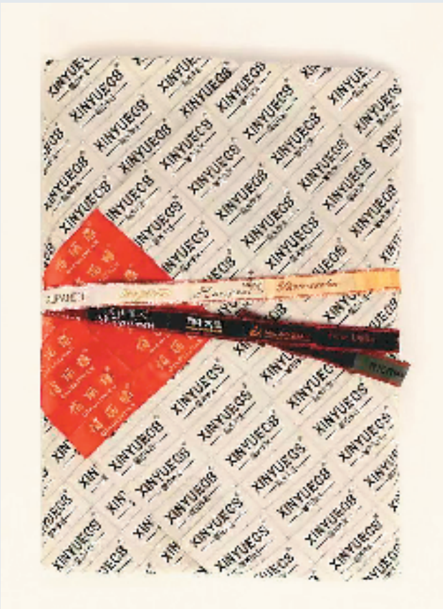
徐冰 小企元七言集 服装标签及计算机写作 2015年至今