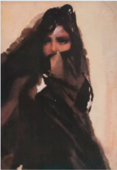
石虎《非洲写生》封面作品 1978年

席沈鹏在北京逝世，享年92岁。首批国务院有突出贡献专家。历任人民美术出版社副总编、编审委员会主任，中国书法家协会第四届主席、第五至八届名誉主席，第八至十二届全国政协委员、中央文史馆馆员、中国文联第六届副主席、中国文联荣誉委员、中华诗词学会名誉会长、中国国家画院书法篆刻院院长。