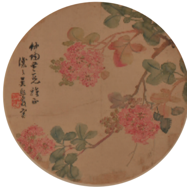
清 吴熙载 《紫薇图》团扇面

本报讯 通讯员 李若明 1月20日,“风之雅——扇面绘画精品展”在安徽博物院老馆西二楼开展。