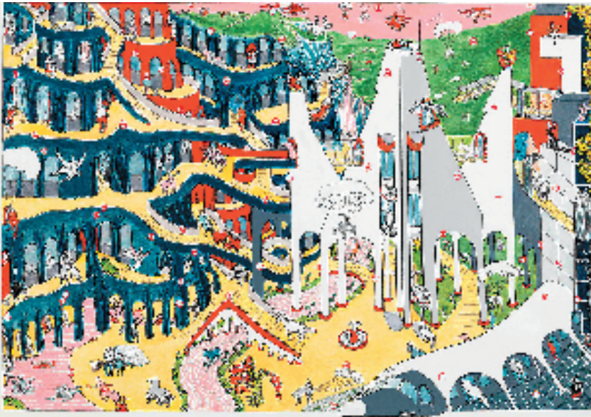
金宇澄 桃花 65.2×95.2cm 纸本丙烯 2019年