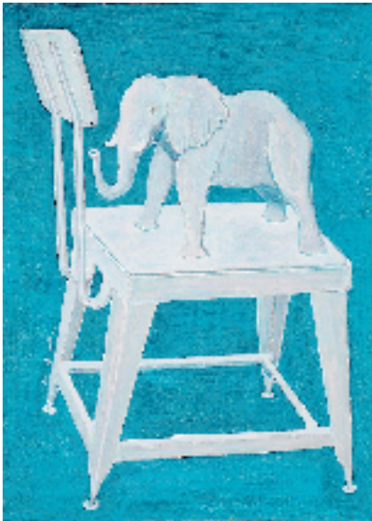
金宇澄 椅子3 74×53cm 纸本丙烯 2023年