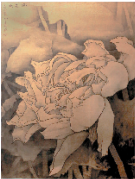
荷香盈盈 43×40cm 水墨旧金屏

读唐子农所画莲荷,乃叹赏其结想,云水之幽绚,又讶异其于精意线描中之神韵超迈。复惊赞其堂皇与肆逸之双畅。子农先生之莲荷于写实中求写意,并求通于中西,以本土线为之魄,将唐风壁画之灿烂线描之精妙于西画之构成治而为一,于笔墨中求色彩,以本土绘画之韵神寓西画之庄严,乃具自家画之魂魄。