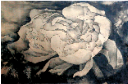
“荷花夜开风露香”苏轼句 60×94cm 水墨旧金屏

子农兄可谓是当世的荷痴,长年以来,他养荷、画荷,情无别移,在传统的格局中,独辟出一个恢宏的境界。所作既有工笔的精微,又有写意的奔驰,乃至丹青的气韵生动,书法的骨法用笔,现代的装饰构成,无不融会贯通,糅于一局。尤以巨幅之制,刻画则一丝不苟,泼染则元气淋漓,周密处不失纤毫,颤腾处惨淡微茫,以穿针之细心,走马之大胆,结构出铺天盖地的风云变幻,波澜壮阔。浩然之气,充塞天地,混沌中放出光明;恬和之心,妙曼庄严,空色中尽显吉祥。子农兄的画