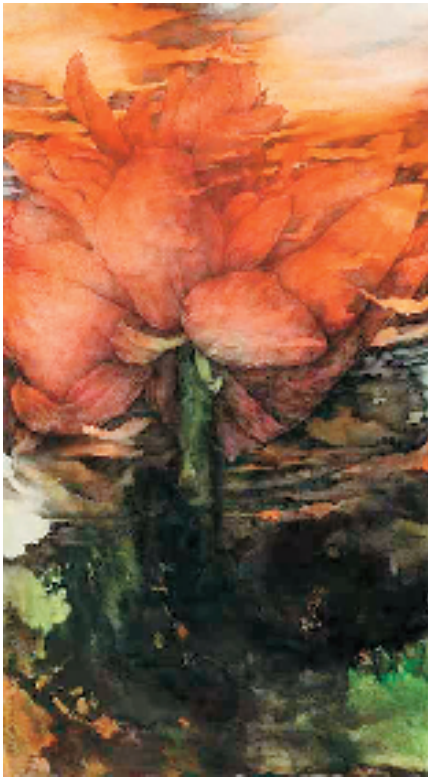
一花一世界 118×65cm 纸本重彩

尺幅那么大,手机里看嘛,小小的屏幕,感觉不到。看到原画还是感觉到了震撼。所以,画一旦超出了它的正常比例,略带夸张、变形,无论从花的形状,还是色彩,产生了一种别样的,超出写实派荷花的意味。象征主义啊,神秘主义的东西,宗教的东西就产生了,唐子农画荷,让人产生一种心灵深处的感应,让人产生一种联想,已经是变成了一种荷花的精神体现了。