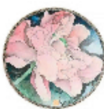
荷香盈盈 43×40cm 水墨旧金屏 香满西湖烟水 15×15cm 绢本重彩