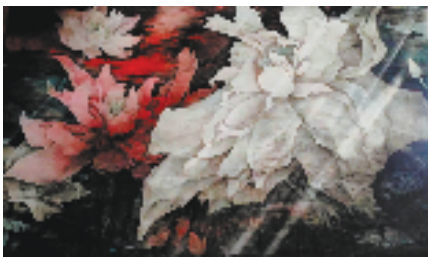
晨旭 126×215cm 纸本重彩