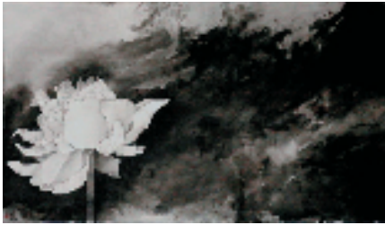
绽放 38×65cm 水墨纸本

我坚信,在他的人生和艺术中,那些至关重要的东西,依然如故。就像我们眼前的那片荷塘,茂密繁盛、挺拔强健,但仍然有着一份惆怅、一份忧伤。从中,我们隐约可以窥见传统文化的那种幽深与静寂,当然也有海派文化那种游离与新进。正是这多重的感觉营造了这个别开生面的荷塘。它属于唐子农,也属于这个时代。