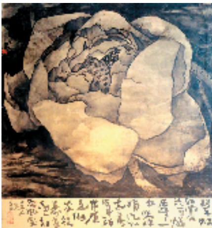
烟雨微微 69×59cm 水墨旧金屏