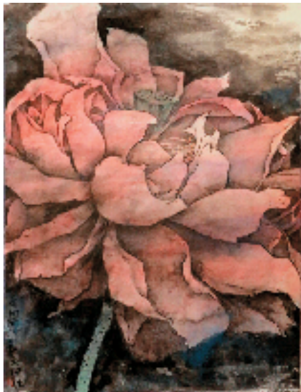
红酣 44×34cm 纸本重彩

出淤泥而不染的荷花是文人画家惯常的表现题材,要画得别具一格必须技法与想法齐头并进才是,缺少任何一个因素都难以有所作为。长期砚池浸淫的唐子农显然有他的不羁本领,他从荷花的造型构图、色彩运用、笔线皴染三方面都强调同步协调,写意中求稳健、单一中蕴丰富、传统中见现代。正像我比较欣赏他的纯