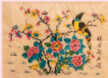
梅花开五福 中国国家博物馆藏