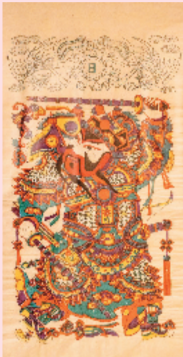
门神(敬德) 中国国家博物馆藏