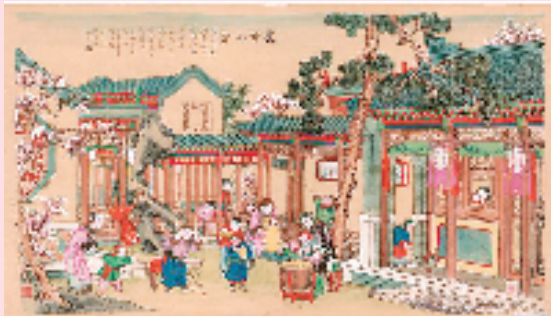
▲庆赏元宵 杨柳青木版年画

北宋时期有《东京梦华录》一书，上面记载“朱元璋入主中原后，到永乐初年，多次迁山西农民和手工业者充实京津一带，有些年画艺人来此，见杨柳青地方梨枣成林，又多蒲苇，是雕刻木版和造纸的好材料，便经营起门神纸马作坊来。”可见，杨柳青当地遍长的蒲苇和杜梨木为杨柳青年画的形成和发展提供了得天独厚的基础条件。