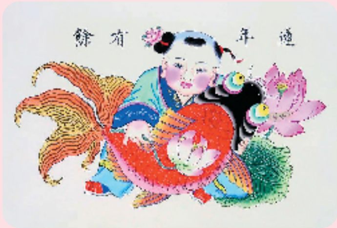
莲年有余 杨柳青木版年画

杨柳青木版年画制作流程分为“勾、刻、印、画、裱”五道工序（见右图），在造型方式和艺术风格上，汲取了中国工笔重彩画和民间版画的精华，其中独具特色的是采用了“半印半绘”的制作方法，将版画的刀法版味与绘画的笔触色调巧妙地融为一体，使两种艺术相得益彰。