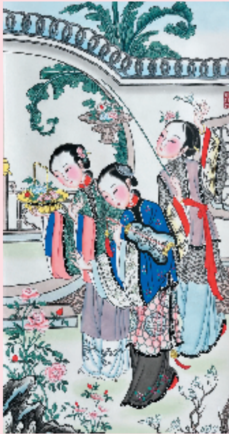
侍女游春 杨柳青木版年画