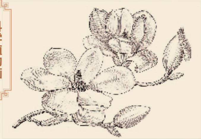
玉兰 墨线图 孙英宝 绘