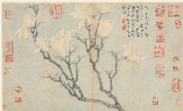
明 沈周 写生册-玉兰 台北故宫博物院藏

古代： 古人将玉兰种植在园林中，往往象征了美好、吉祥的寓意。比如，始建于南宋时期苏州的网师园，在它的大厅前天井就种植了玉兰，后天井种植了金桂、银桂，合在一起就是“金玉满堂”的意思。古代的文人们也很喜欢玉兰，比如明代文人李渔就这样形容玉兰：种花需要一年，欣赏却只有十天。这样的一树好花，哪怕是一场小雨都会让它迅速变色。所以，当玉兰开花的时候，要抓紧时间去看。如果它刚刚开放的时候不来看，它很快就全开了；全开的时候不来看，它很快就盛开了；盛开时还没来得及看，好的风景很快就消失了。