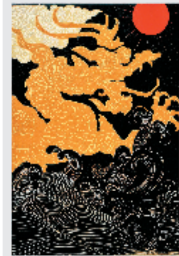
王承利 甲辰腾龙 绝版木刻