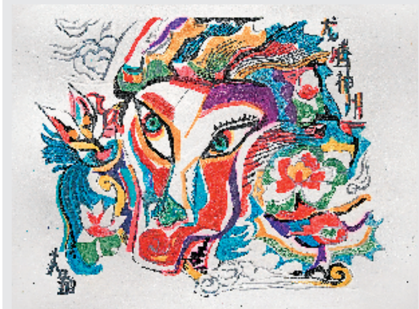
班苓 龙腾神州-醒龙 水印木刻