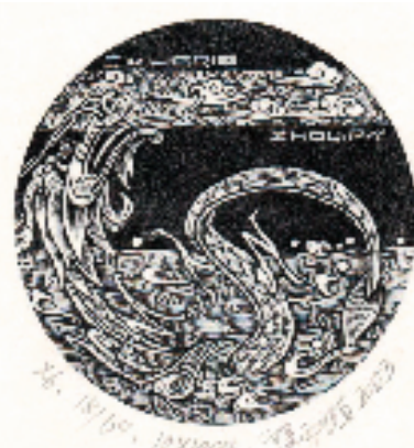
崔正植 海龙王 塑料凸版