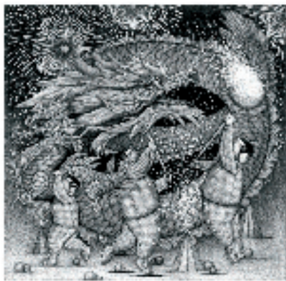
王禹 龙腾虎跃 美柔汀