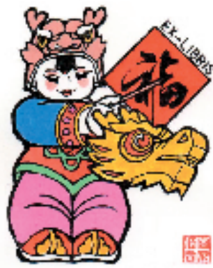
宫建国 甲辰年观灯 油印木刻