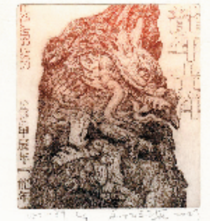
刘硕海 龙年吉祥 铜版画