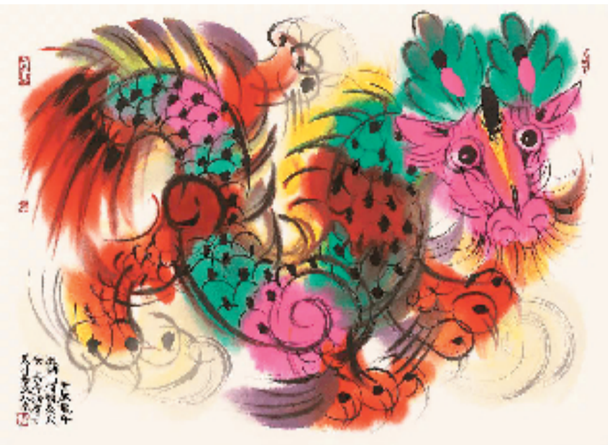
装饰意味浓郁的韩美林画笔下的龙