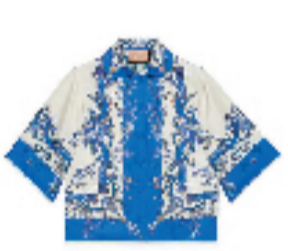
Gucci印花双面真丝衬衫