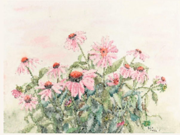
钱晓芳 菊 41x55cm 纸本水彩

起画笔的那一刻起，晓芳便将这种细心植入花木之中。水彩画水晕水洗，要的也正是这种细心。晓芳像一位花匠一般，抚育伺弄着这些叶藿花瓣。晓芳的细心，朴实，伴着日日入迷入心的观赏，竟有着这种花开浪漫、诗心浪漫的向往。