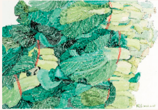
钱晓芳 青菜之二 28x37cm 纸本水彩

中国美术家协会主席范迪安，中国文联副主席、浙江省文联主席、中国油画学会会长、中国美术学院学术委员会主任许江发来贺词；中国美术学院教授、博士生导师、中国美协水彩艺术委员会副主任周刚，中国美院原党委副书记、二级教