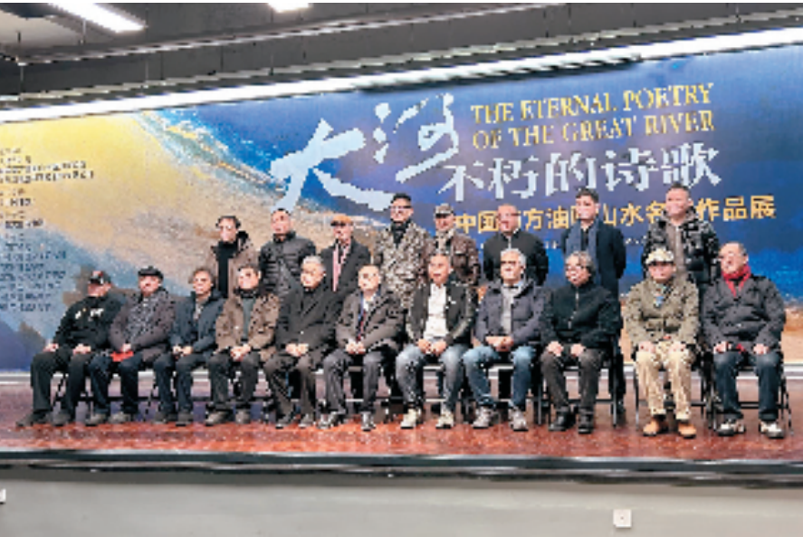
参加展览开幕式的艺术家合影留念