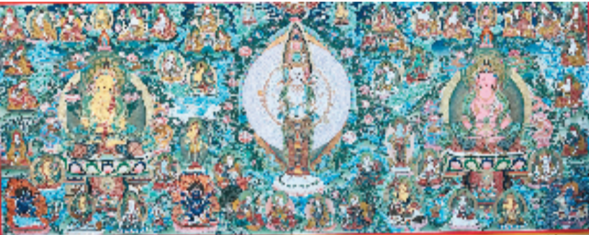
现场展出的唐卡作品

本报讯 效力 一批唐卡佳作近日在湖州市长兴县夹浦镇月明村银鼎山庄长期展出。这批由清华大学美术学院绘画系特聘教授嘎藏加措创作的60幅唐卡艺术佳作,集中展示了这位人类非物质文化遗产代表性传承人精湛的绘画艺术。其